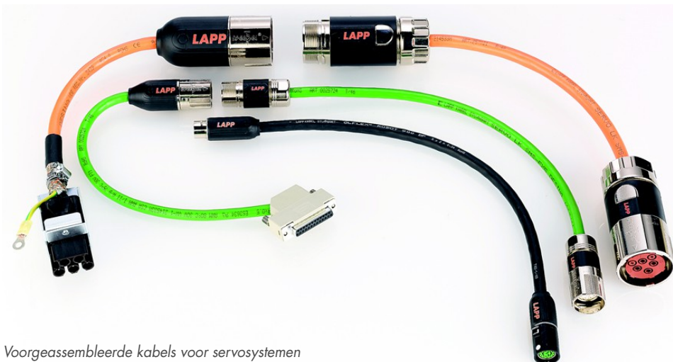
Voorgeassembleerde kabels voor servosystemen