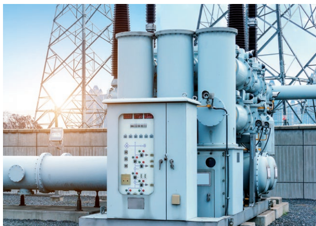
+ Veřejné sítě