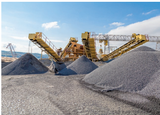
+ Důlní průmysl