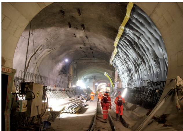
+ Výstavba tunelů