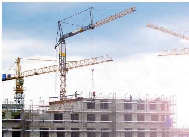
+ Pozemní a inženýrské stavby