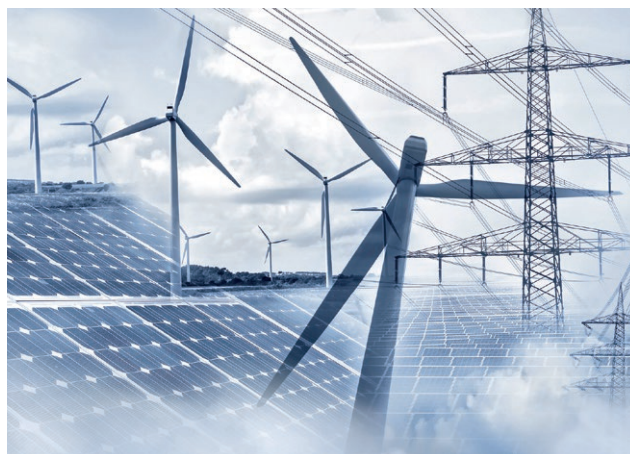
+ Obnovitelné zdroje energie