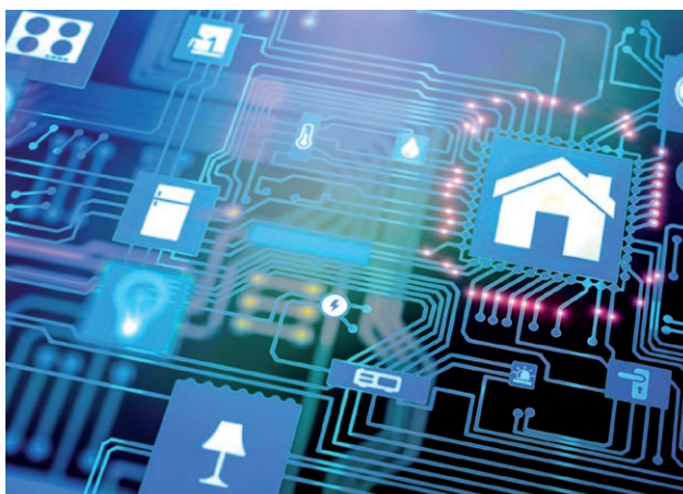
+ Automatizace budov