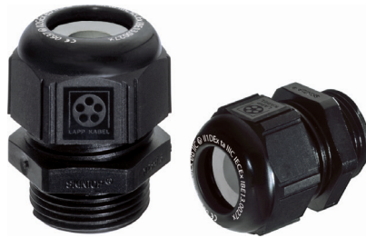
SKINTOP® KR-M ATEX plus