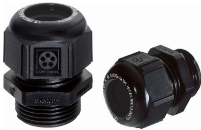
SKINTOP® K-M ATEX plus