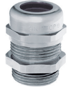
SKINTOP® MSR-M SKINTOP® MS-M