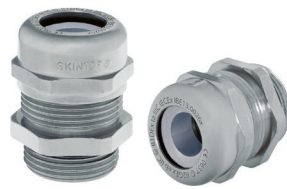
SKINTOP® MSR-M ATEX