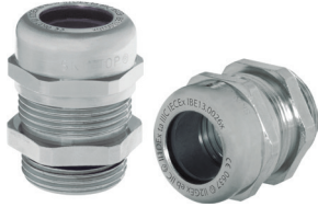
SKINTOP® MS-M ATEX