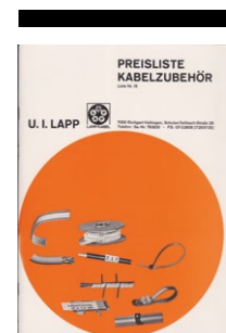
Jeden z pierwszych cenników LAPP