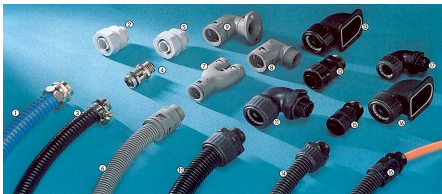
Niektóre produkty firmy Lapp Kabel: 1 - Silvyn FD-PU i Silvyn US, 2 - Silvyn USK, 3 - Silvyn SP-PU i Silvyn SSV, 4 - Silvyn SSVZ, 5 - Silvyn USK, 6 - Silvyn RILL i Silvyn KLICK-GP, 7 - Silvyn KLICK-Y, 8 - Silvyn KLICK-WP, 9 - Silvyn KLICK F, 10 - SilvynURC i Silvyn HG, 11 - Silvyn HW, 12 - Silvyn DUO Tubing / cable Glands, 13 - Silvyn HF, 14 - Silvyn HCC i Silvyn HG, 15 - Silvyn DUO Tubing / Cable Glands, 16 - Silvyn HF, 17 - Silvyn HW

→ osłonowych grupy Silvyn. Najczęściej ze względu na względy mechaniczne wykorzystywany jest wąż Silvyn LCC, a ze względu na uniwersalność połączeń i odporność temperaturową – wąż Silvyn RILL.