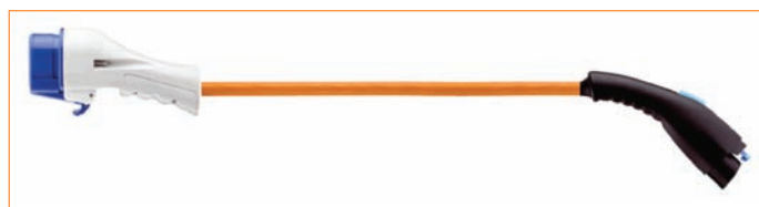
Cablul cu fișă tip 1