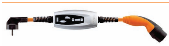
Cablul cu regulator de încărcare inclus, în 5 trepte, pentru curent între 6 și 16 A

Variantele de tip 5G2,5 + 1x0,5 și 5G6 + 1x0,5 sunt destinate alimentării trifazate.