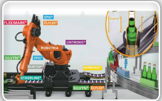
LAPP standardni produkti v robotiki

Za zagotavljanje konstantnega spreminjanja nalog robota morajo biti vse komponente na to