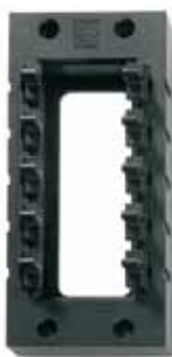
SKINTOP® CUBE FRAME