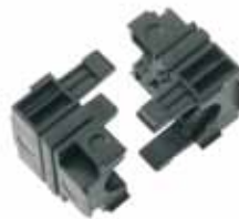
SKINTOP® CUBE MODULE