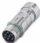
EPIC® LS1 F6 Skarvpropp

Kabelpropp med hylskontakter, enkel skärmanslutning och egen märkning skyddat av en plastring.