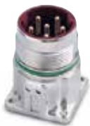
EPIC® LS1 A1 Chassitag

Vanliga användningsområden för EPIC® CIRCON LS1 är servomotorer, robotar eller generell industriautomation med krav på kompakta kontaktdon med höga prestanda.