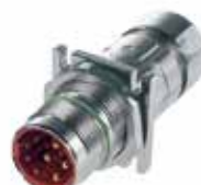
EPIC® LS1 F7 Skarvpropp

Skarvpropp med stiftkontakter, enkel skärmanslutning och egen märkning skyddad av en plastring.