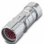
EPIC® LS1 D6 Kabelpropp

Chassitag med hylskontakter och invändig gänga, montagefläns och O-ringstättning, fästhål 4 x Ø 2,7 mm.