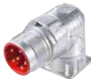
EPIC® LS1 A3 Chassitag 90°

Chassitag med stiftkontakter, flänsfäste med fästhål 4 x Ø 2,7 mm.