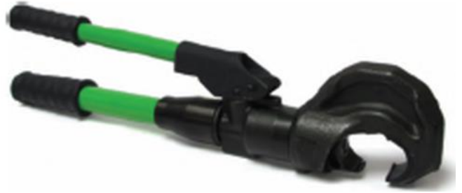
1) Powerlock Crimpwerkzeug C 130